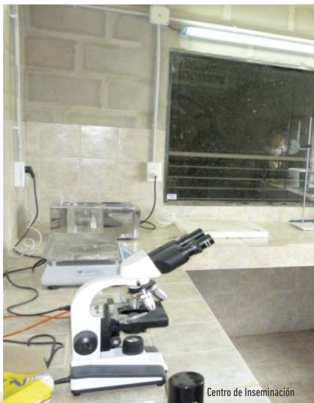
Centro de Inseminación