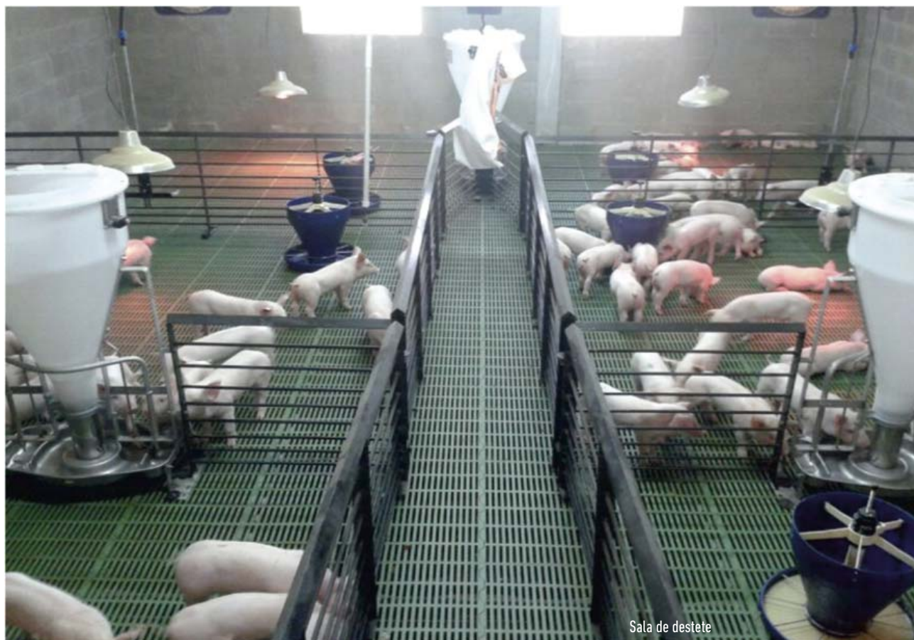
Sala de destete